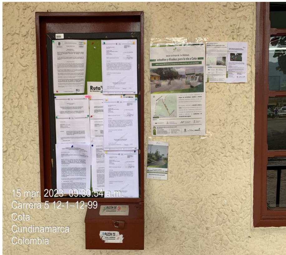
Fotografía 1. Revisión de PSI.