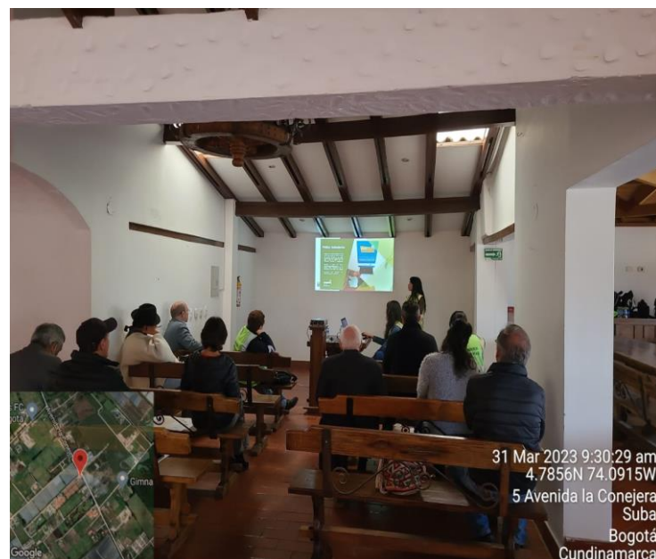
Fotografía 3. Comité IDU No.2 realizado en el Club Laverdieri el día 31 de marzo de 2023.