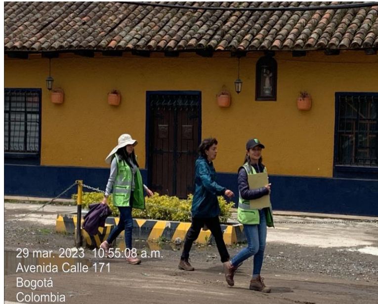
Fotografía 2. Recorrido Urbano entre la Calle 170 con carrera 92 hasta el Club Laverdieri.